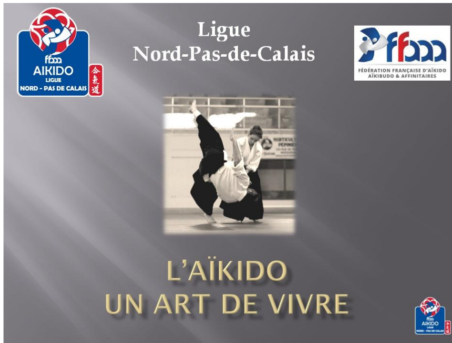
Page de garde du diaporama 2