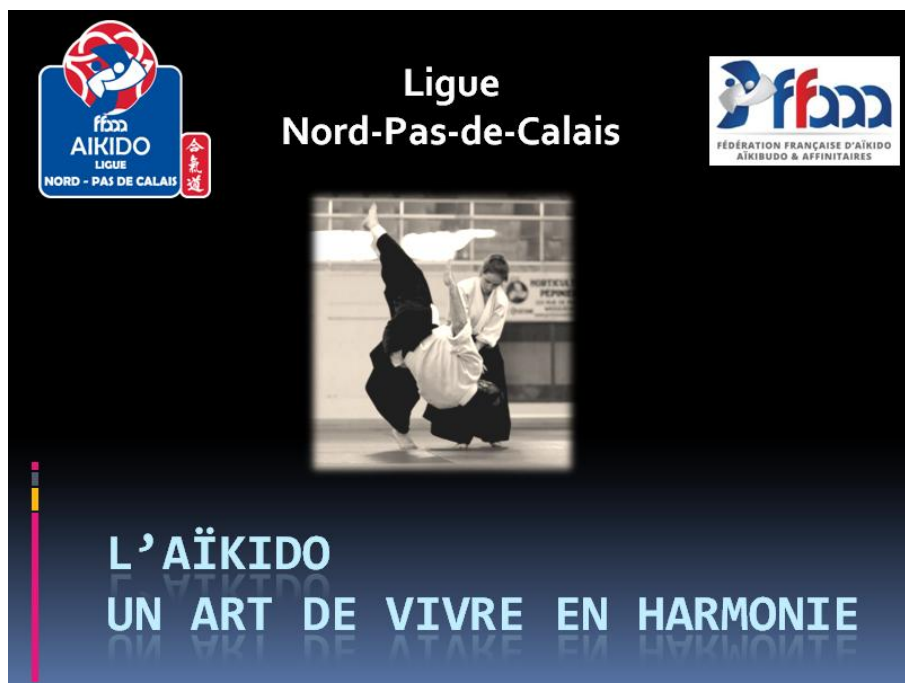
Page de garde du diaporama 1

Voici, en avant première, les pages de garde de ces trois diaporamas :